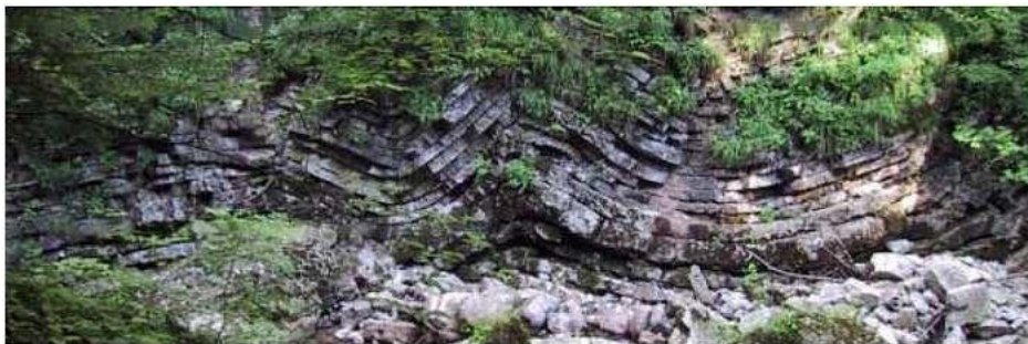
Bild: Erdverwerfungen, sind unterirdische geologische Verschiebungen von Erdplatten, Felsbrüche, verschiedenster Gesteinsmaterialien ( z. B. Kohle, Erz, etc. )

Stehen Bäume auf geopathisch belasteten Standorten, bilden sich nicht selten tumorartige Gewächse aus. Ein Baum kann seinen Standort nicht einfach wechseln und er „wehrt“ sich oder erkrankt auf seine Art und Weise.